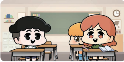
학교폭력 예방교육 동영상(초등용)

🔍 학교폭력 예방교육 동영상 을 통해 학교폭력이 무엇인지, 학교폭력을 경험했을 때 어떻게 행동해야 하는지를 학습할 수 있습니다.